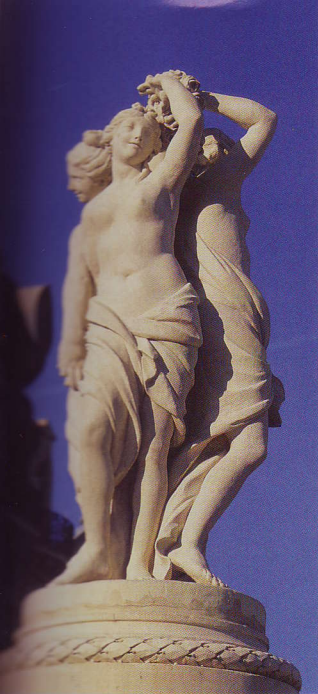
La statue des Trois Grâces sur la place de la Comédie.